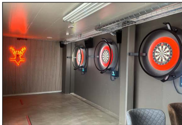
Silli Kokkur býður upp á góðar aðstæður fyrir pílukast.