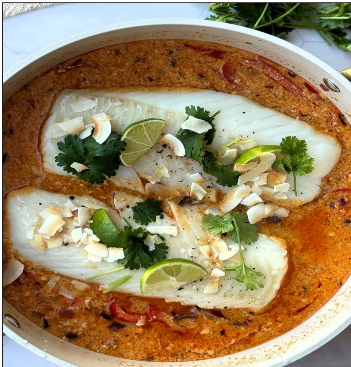
Tælenski fiskrétturinn þar sem þorskuhnakkar úr Hafinu leika aðalhlutverkið.

sósu; hitið blönduna að suðu. Setjið þorskinna á pönnuna með sósunni, kryddið með salti og pipar, lokaðu pönnunni og lækkaðu hitann niður í miðlungshita. Látið malla í 14 - 16