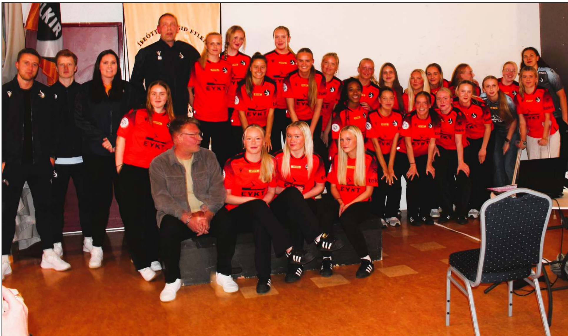
Stelpurnar í Fylki hafa lagt gríðarlega mikið á sig í undirbúningi fyrir leiktíðina í sumar.