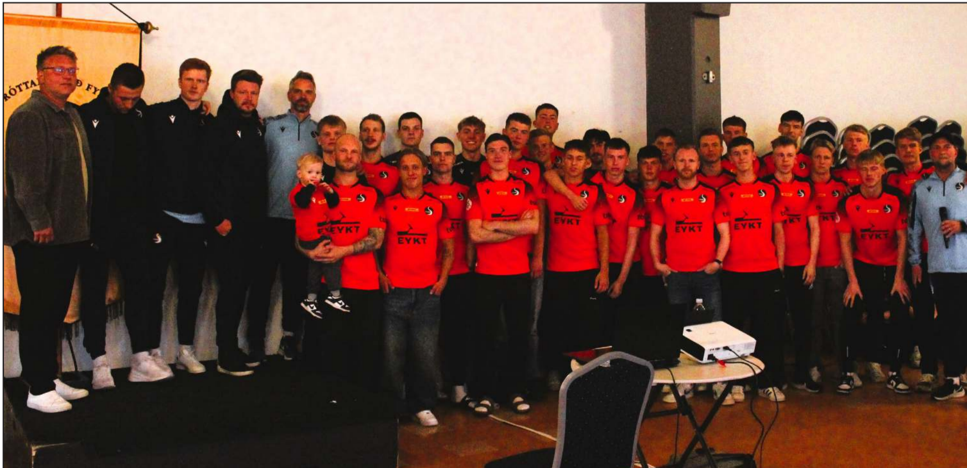
Leikmannahópurinn hjá Fylki er sterkur og liðið mætir mjög vel undirbúið til leiks í Bestu deildinni í sumar.

„Það verður partý í Bestu deildinni í sumar. Fylkisliðið kemur vel undirbúið til leiks í geggjúðu standi. Liðsheild - samstaða og Fylkislið sem gefst aldrei upp. Ég vona svo sannarlega að við fáum öflugan stuðning í sumar og fólk mæti í Orange til að styðja okkur í blíðu og stríðu. Þetta sumar verður frábært, liðið samanstendur af heimamönnum, 80-90% af Fylkisstrákum, sem þurfa ykkar stuðning, áfram Fylkir.“