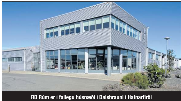
RB Rúm er í fallegu húsnaði í Dalshrauni í Hafnarfirði

100% náttúrulegar springdýnur Og þið bjóðið upp á ótrúlega fjölbreytt vöruúrval, ekki bara margar gerðir að springdýnum og rúmum heldur margt annað eins og þú nefnir? „Já, það er rétt og í tilefni af þessum tímamótum