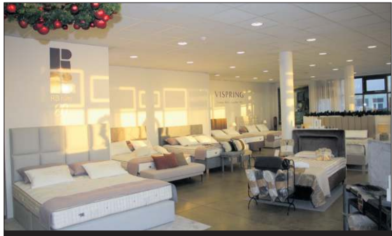
RB Rúm er með rúm, springdýnur og rúmgafli í miklu úrvali ásamt sænguverðum, púðum og rúmteppum og þá er hægt að fá vandaða gjafavöru eins og ilmkerti, handklæði og margt fleira

ákváðum við að byrja að flytja inn 100% náttúrulegar springdýnur frá rótgrónu fyrirtæki í Bretlandi sem heitir Vispring, en það var stofnað í London árið 1901. Við munum veita góða þjónustu fyrir dýnnar eins og við gerum með allar okkar dýnur.”