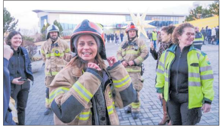
Rýming bæjarskrifstofa Kópavogsbæjar að Digranesvegi 1 vegna elds og reyks var æfð sl þriðjudag.

Rýmingar- og björgunaræfing í bæjarskrifstofum Kópavogsbæjar