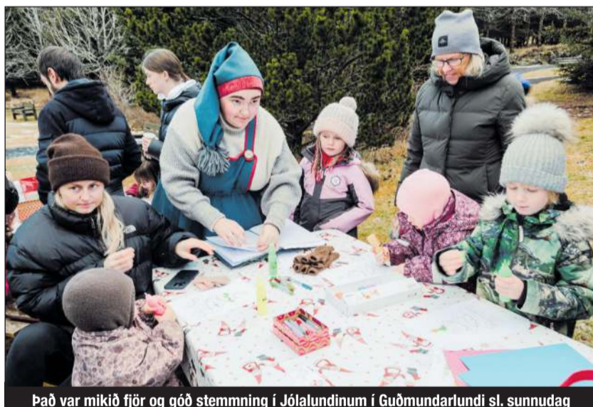
Það var mikið fjör og góð stemning í Jólalundinum í Guðmundarlundi sl. sunnudag

Í aðdraganda jóla er hægt að finna fjölda viðburða í Kópavogi