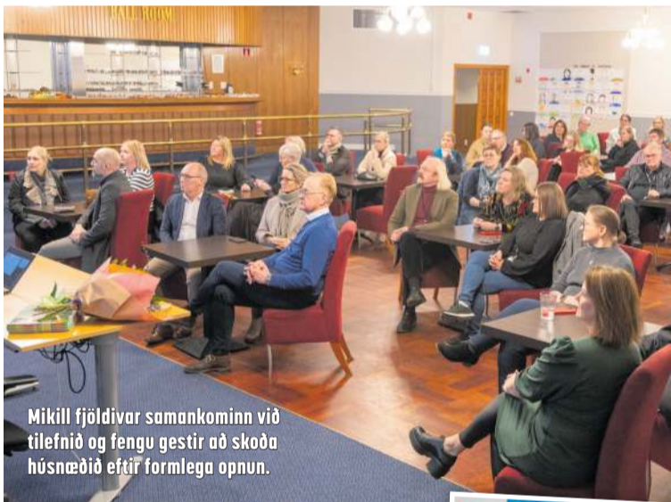
Mikill fjöldi var samankominn við tilefnið og fengu gestir að skoða húsnæðið eftir formlega opnun.