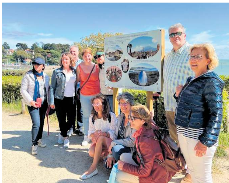
Stóru-Vogaskóli hefur tekið þátt í Erasmus+ verkefnum (áður Comenius) á vegum Evrópusambandsins í rúman áratug og fyrir tveimur árum heimsóttu nemendur úr áttunda bekk franska skólann Collège Jean Mounies.

Landsskrifstofa Erasmus+ á Íslandi veitti ferðastyrki fyrir allt að átján grunnskólakennara af Suðurnesjunum til að sækja vikulangar vinnustofur í evrópskum jarðvöngum en fyrsta ferðin var farin til Danmerkur í lok mars.