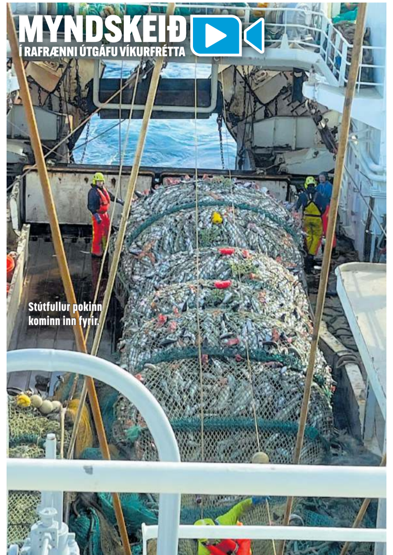
Stútfullur þokinn kominn inn fyrir.

„Þetta eru öðruvísi túrar yfir sumarið, þá er meira verið að eltast við grálúðu sem kallar á minni vinnu því það er dregið lengur og vinnslan gengur hraðar fyrir sig, það er betra veður og hin áhöfnin fær þá gott sumarfrí á meðan.“