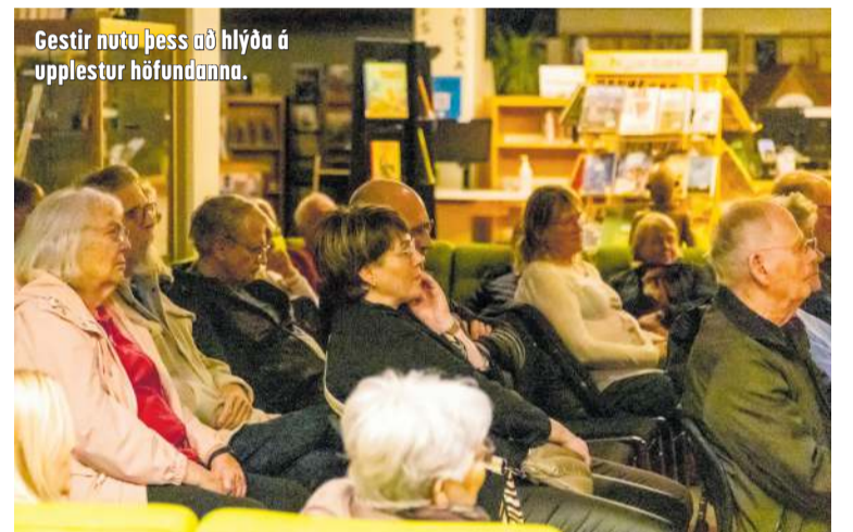
Gestir nutu þess að hlýða á upplestur höfundanna.