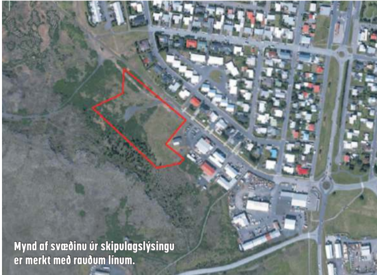
Mynd af svæðinu úr skipulagslýsingu er merkt með rauðum línunum.

Náttúrufar svæðisins einkennist að mestu af hrauni, sem gerir gróð-