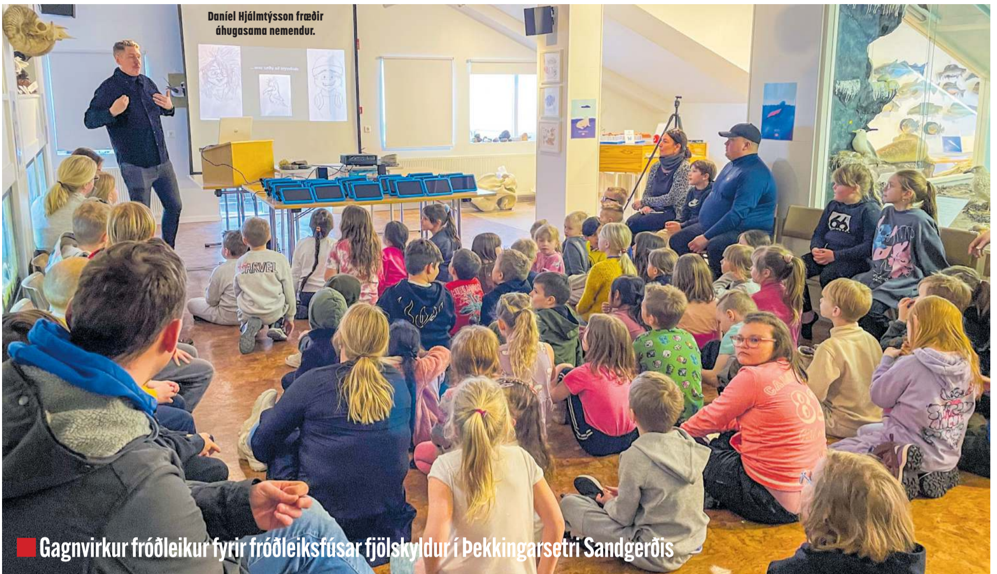
■ Gagnvirkur fróðleikur fyrir fróðleiksfúsar fjölskyldur í Þekkingarsetri Sandgerðis