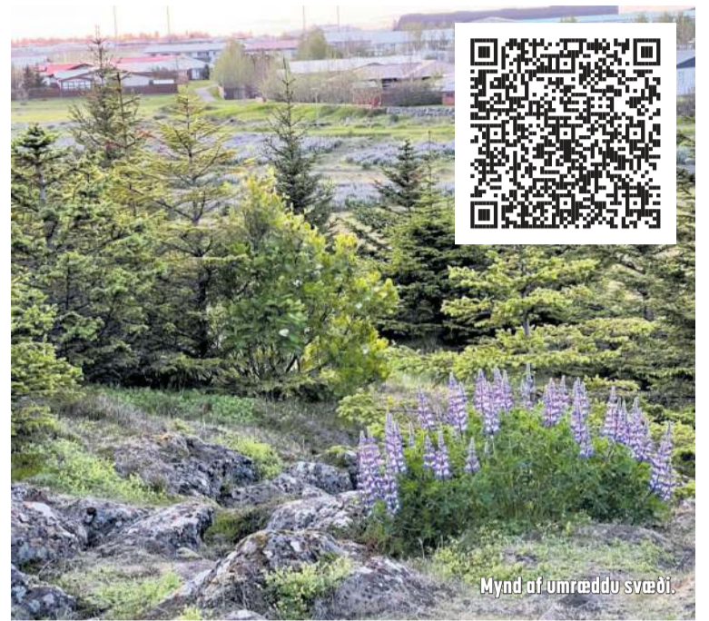
Mynd af umræddu svæði.

Að breyta þessu svæði í svæði undir íbúðabyggð myndi ekki aðeins valda óafturkræfum umhverfisskaða heldur einnig rýra lífsgæði