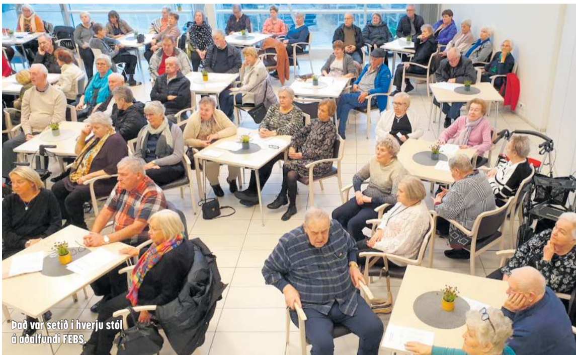
Það var setið í hverju stól á aðalfundi FEBS.