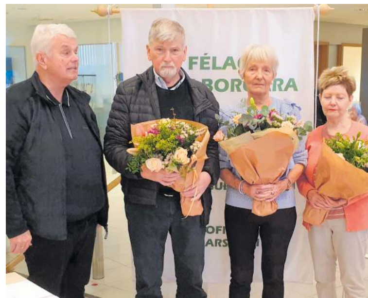
Kristján formaður að þakka fráfarandi stjórnarmönnum langt og gott starf í þágu FEBS.