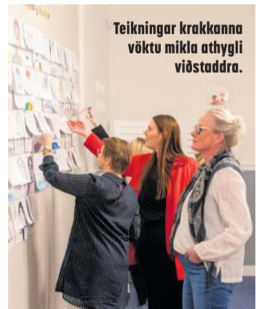
Teikningar krakkanna vöktu mikla athygli viðstaddra.

Þetta er í raun hugsað sem tímabundið úrræði á meðan þessi staða er, að fjölskyldur bíða eftir að fá kennitölur og komast inn í kerfið, svo þegar börnin eru komin til að vera fara þau út í skólana – og þá erum við vonandi búnir að gera góða hluti og höfum náð að undirbúa þau vel. Að þau séu komin með grunnorðaforða og eru þá sterkari að byrja í skólanum.“