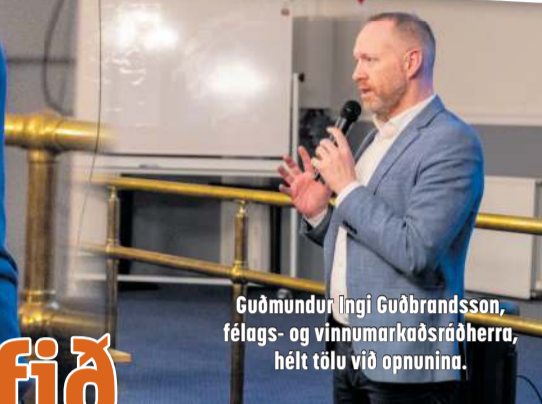
Guðmundur Ingi Guðbrandsson, félags- og vinnumarkaðsráðherra, hélt tölu við opnunina.