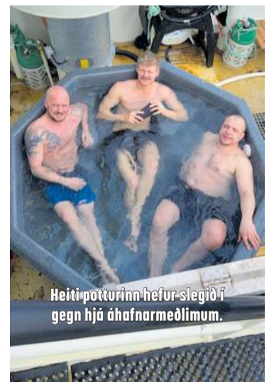
Heiti-potturinn hefur slegið í gegn hjá áhafnar-meðlimum.

„Hefðbundinn dagur hjá mér er þannig að ég er venjulega vaknaður um átta leytið, kíkji upp og sé hvernig staðan er og leysi svo nafna minn af um hálf tíu leytið, við reynum að miða við að standa sitthvora tólf tímuna. Oft er ég kominn niður um hálf ellefu en þegar mikið fiskerí er kíkjum við niður í vinnsluna og hjálpum til. Mér finnst alltaf gaman að taka á því niðri í vinnslunni, þá er líf í tuskunum. Þegar ég er kominn af vakt reyni ég að kíkja í bók, við erum með fina líkamsrækt hér um borð og ég er nú alltaf á leiðinni að stunda hana meira. Við erum með heitan pott svo það fer vel um okkur en minn hugur er nánast stöðugt við vinnuna en maður reynir að slaka sér þegar færi gefst til.“