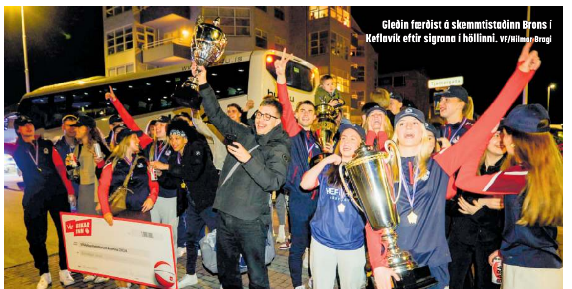
Gleðin færðist á skemmtistaðinn Brons í Keflavík eftir sigrana í höllinni.